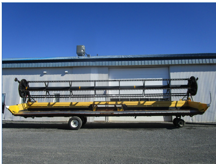
TABLE A GRAINS NEW HOLLAND 880CF-35